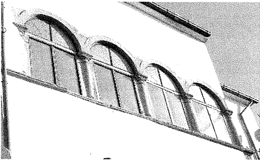
Loggiato cinquecentesco dell'ex palazzo baronale