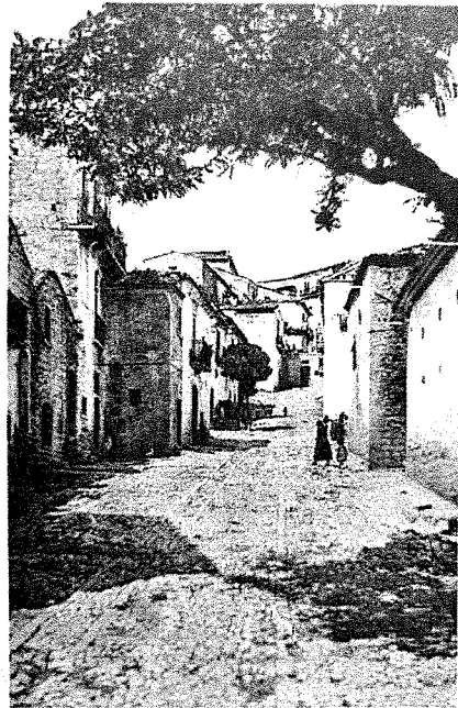
Corso Garibaldi - ApP