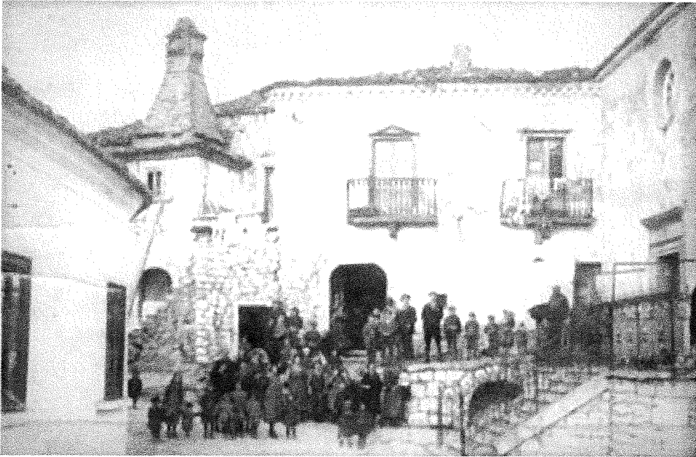
Largo Annunziata