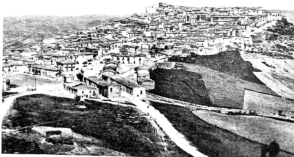
Vecchia cartolina di Panni, il panorama veduta est - ApP