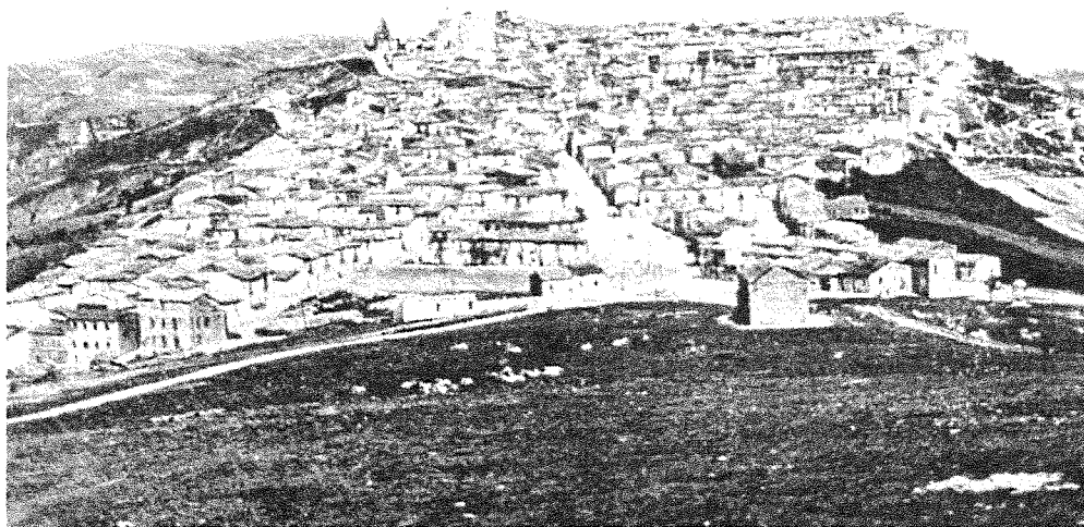
Vecchia cartolina di Panni, il panorama veduta sud - ApP