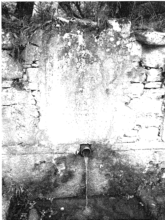
Fontana a li vadd'